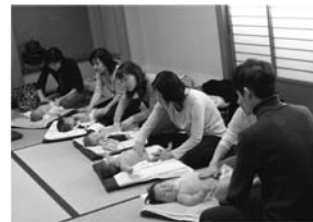
赤ちゃん気持ちよさそう～