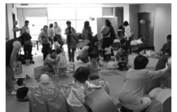
いろんな遊具、楽しいね