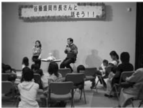
会場のママさんから