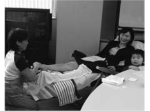
頑張りママもしばしの休息… たまにはご褒美♪