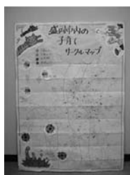
盛岡市内サークルマップ

レポーターの皆さんが取材を行ったサークルを地図、ファイルにまとめ来場して下さいました方にご覧になって頂きました。